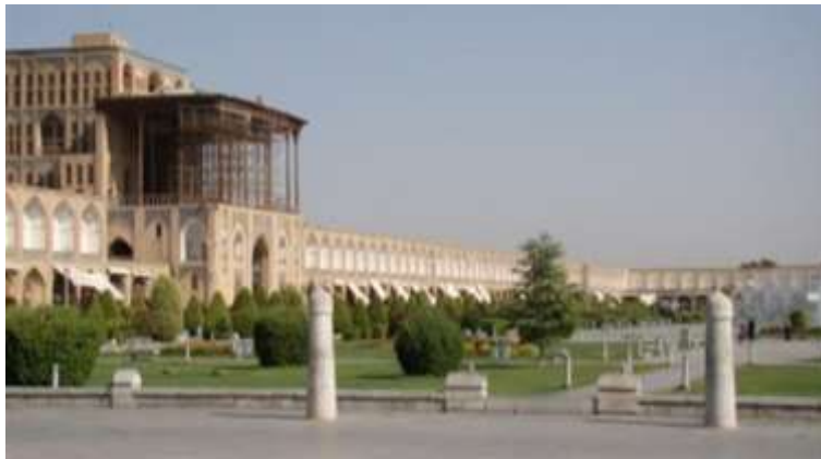
تصویر هالگاه جنوبی میدان نقش جهان اصفهان