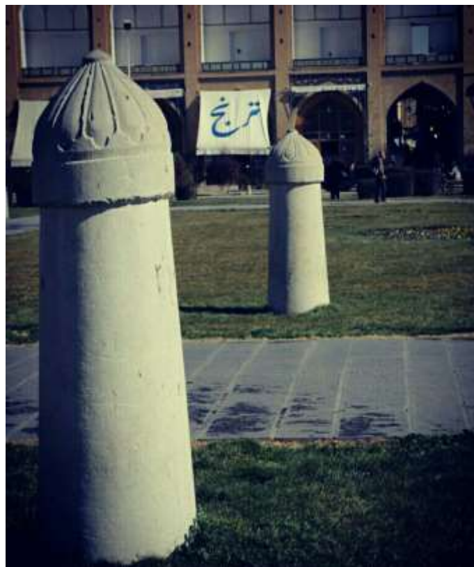
تصویر هالگاه شمالی میدان نقش جهان اصفهان